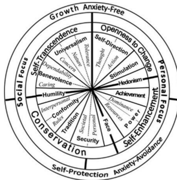
Abb. 1: Wertemodell (Schwartz et al., 2012, S. 72)

vorgeschlagen, in der die Wertepaare eine konzeptionelle Affinität aufweisen, die durch eine thematische Brücke miteinander verbunden ist. Die zehn Wertetypen werden innerhalb der Kreisstruktur anhand der verwandten Motivationen zu vier Wertebereichen (Openness to Change vs. Conservation und Self Enhancement vs. Self Transcendence) zusammengeschlossen, welche wiederum in zwei grundlegende Orientierungslinien eines sozialen und eines persönlichen Fokus der Wertorientierung gegliedert werden können (Schwartz, 2012).